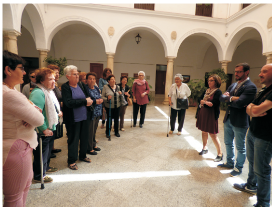
Recepción en el Ayuntamiento

Tras conocer algunos puntos emblemáticos de nuestra localidad, la comitiva celebrará una